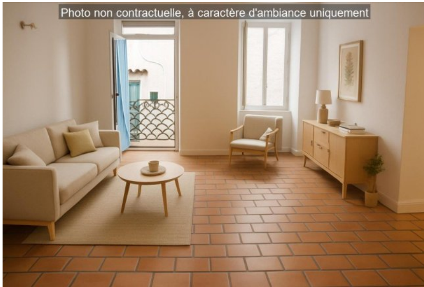
Photo non contractuelle, à caractère d'ambiance uniquement